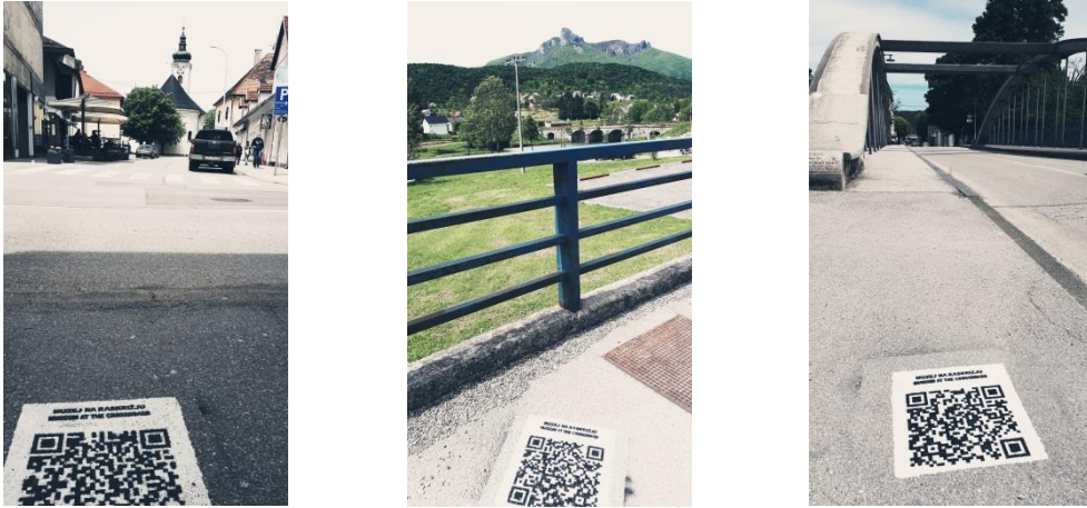
Slika. 3., 4. i 5. – projekt „Muzej na raskrižju“ na ulicama grada Ogulina

U sklopu projekta snimljen je i kratki promo video o projektu, te su svi popratni tekstovi prevedeni na engleski jezik.