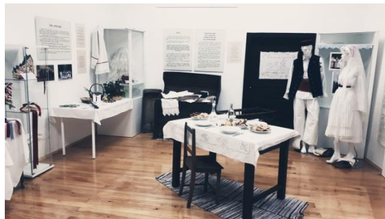
Slika 6. Izložba „To nije dar nego ljubav“

Program je sufinanciran sredstvima Karlovačke županije.