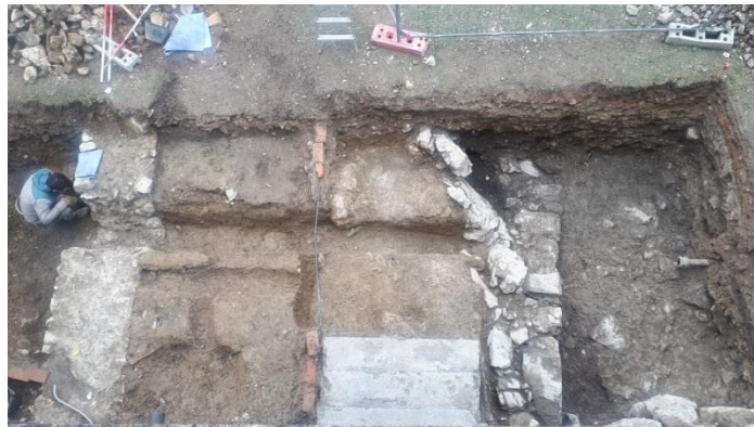
Slika 11. Arheološki radovi na ulaznoj površini u Muzej

Postojeće stanje dokumentirano je za buduću prezentaciju kojoj se nadamo nakon popločavanja cjelokupnog južnog dijela dvorišta Starog grada Ogulina.