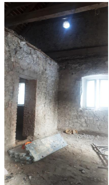
Slika 9. i 10. Radovi unutarnjeg rušenja i demontaže u konjušnici, studeni/prosinac 2021.