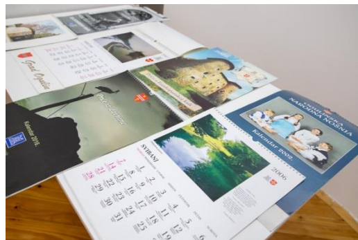
Slika 8. i 9. Izložba „U korak s vremenom“