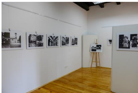
Slika 7. Izložba „Ogulin – portret grada camerom obscurom“

Izložba je u Zavičajnom muzeju Ogulin bila otvorena do 31. listopada 2021. godine i posjetilo ju je 1 230 posjetitelja. Ulaz na izložbu je bio besplatan.